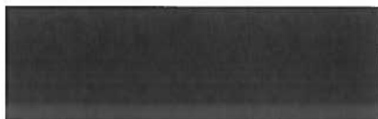
A.A.A.M. Huldy Afdelingsmanager COVOG

De Staatssecretaris van Veiligheid en Justitie, namens deze,